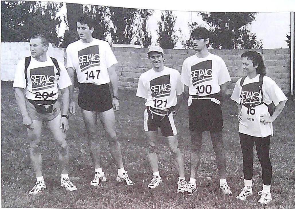
Les coureurs du Canton