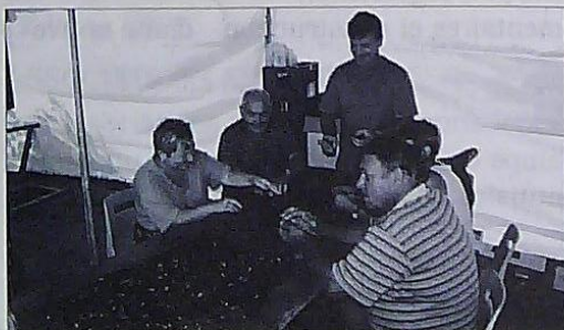
Le comité des Fêtes de l'Armor au travail