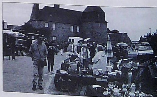
Brocante du 15 août au Launay