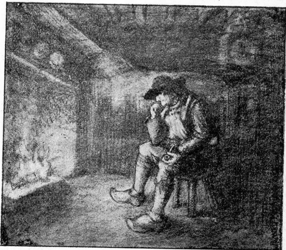
AN NOZ OUZ SKLERIJEN AL LUTIK.... (*)

en e zao. Goudeze, ha gant eur basianted dreist-ordinal, e teuaz a-benn da chench e c'hiz-skriva ha da baka an tu da gaout eur skritur-plean, dam henvel awalc'h deuz skritur unan bet er skol !