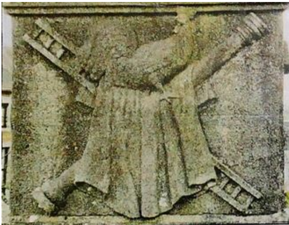
Le coq qui confondit Saint Pierre ; la tunique de Jésus. En diagonales : l'échelle de la descente de croix, la colonne à laquelle Jésus fut attaché pendant la flagellation.

Les sculptures de la mace font écho à la peinture murale de l'église ; cependant le sculpteur a représenté davantage d'instruments de la Passion.