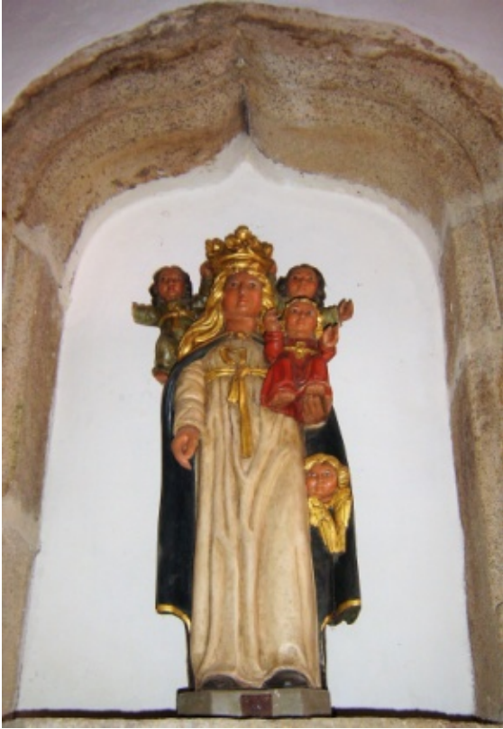
Vierge aux Angelots : statue originale du 16 ème siècle. (porte la tiare).

Sainte Marguerite a été choisie par la dévotion populaire comme protectrice des femmes enceintes. C'est sûrement pour cela qu'on la trouve presque toujours dans nos églises ou chapelles.