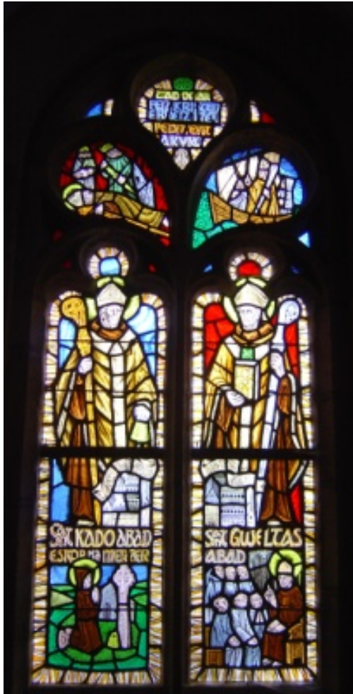
Saint Kado (Cado, second patron de l'église)

Trois vitraux de Pierre Etienne Toulhoat (1923-2014) peintre vitrailliste quimpérois, furent bénis le dimanche 26 juillet 1987.