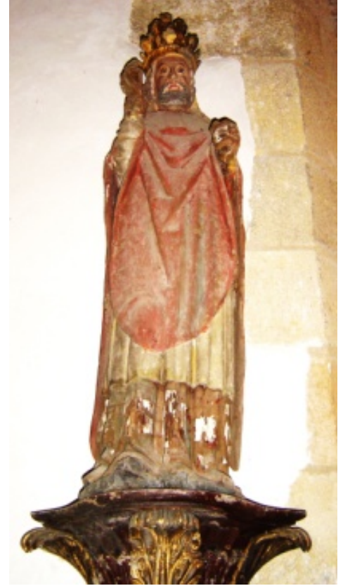
Saint Pierre : premier pape de l'Eglise