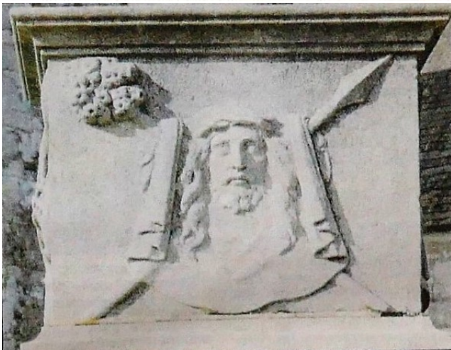
On reconnaît la face du Christ, imprimée sur le voile de Véronique, femme ayant essuyé le visage de Jésus sur son chemin de croix. En diagonales : l'éponge imbibée de vinaigre qui désaltéra Jésus en croix, et la lance qui lui perça le cœur après sa mort.