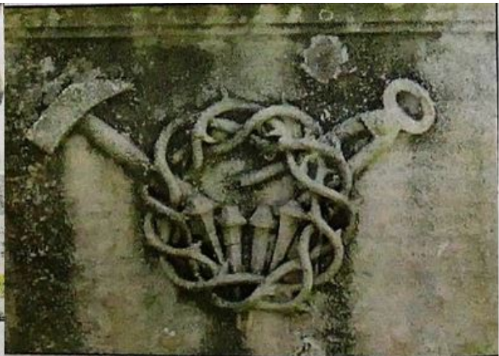
La couronne d'épines, le marteau et la tenaille, les gros clous.