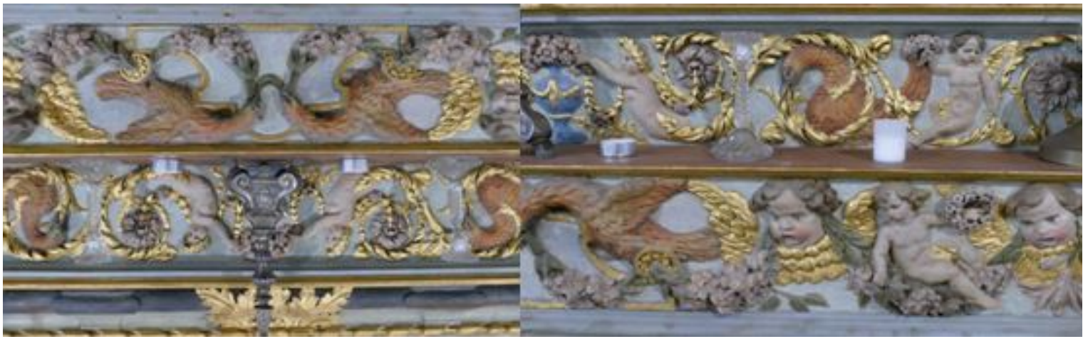
Détails décoration du retable