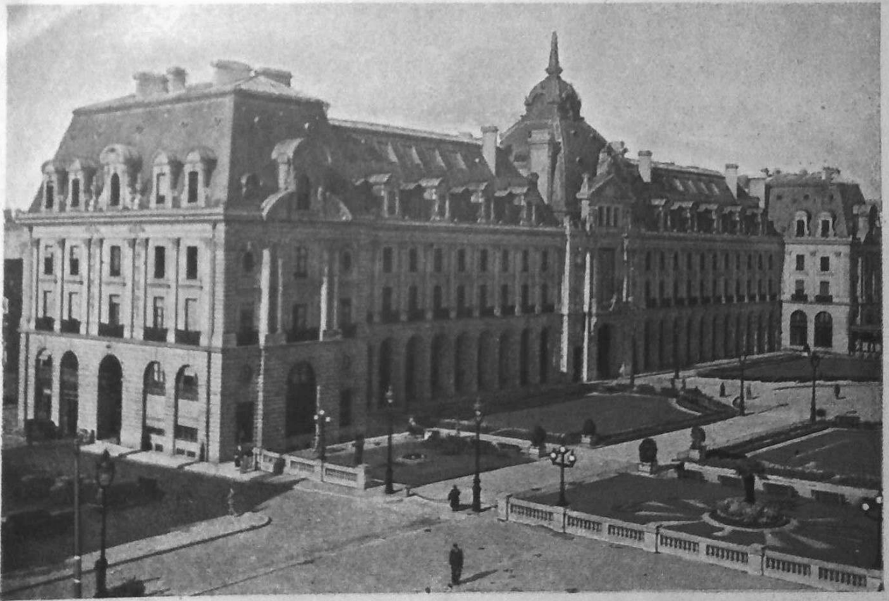
Le Palais du Commerce - Rennes