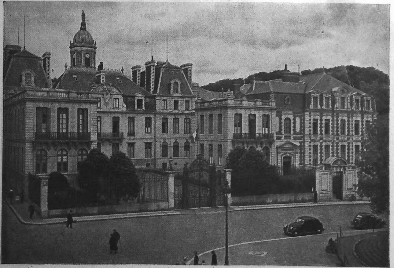
La Préfecture - Rennes