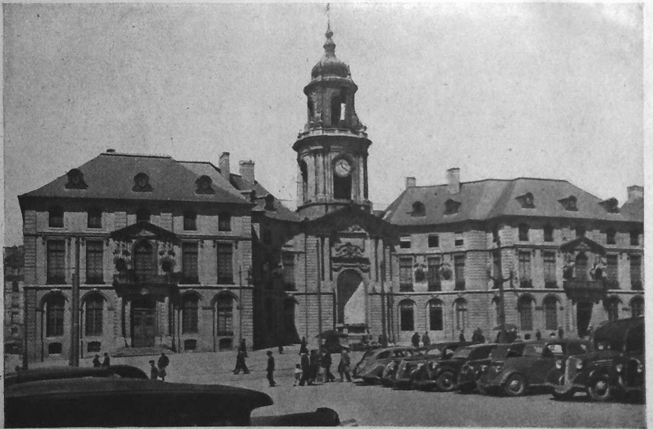
L'Hôtel de Ville - Rennes