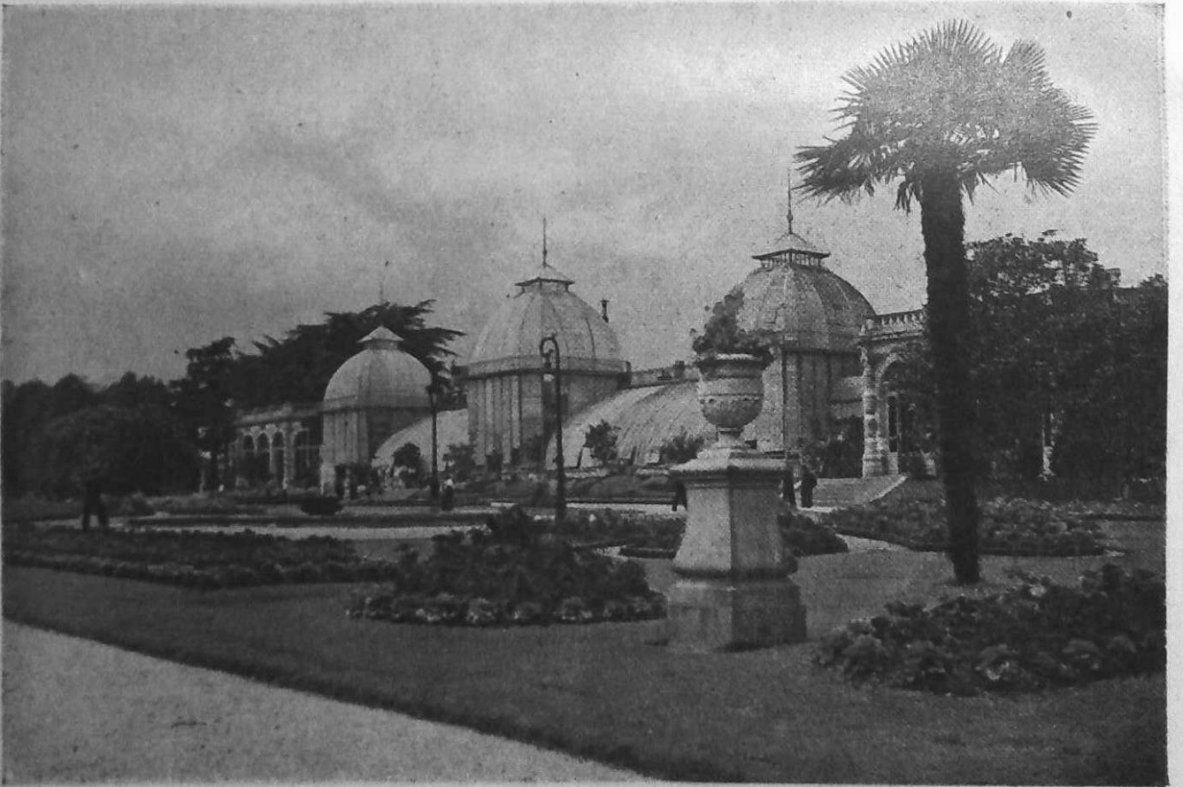
Jardin des Plantes. — Les Serres - Rennes