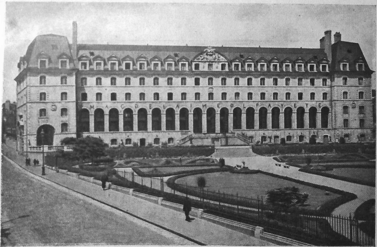
Palais Saint-Georges - Rennes