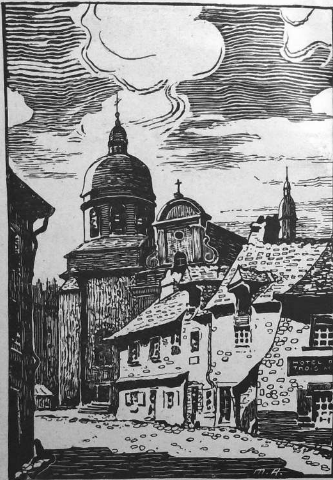
Église Saint-Étienne - Rennes