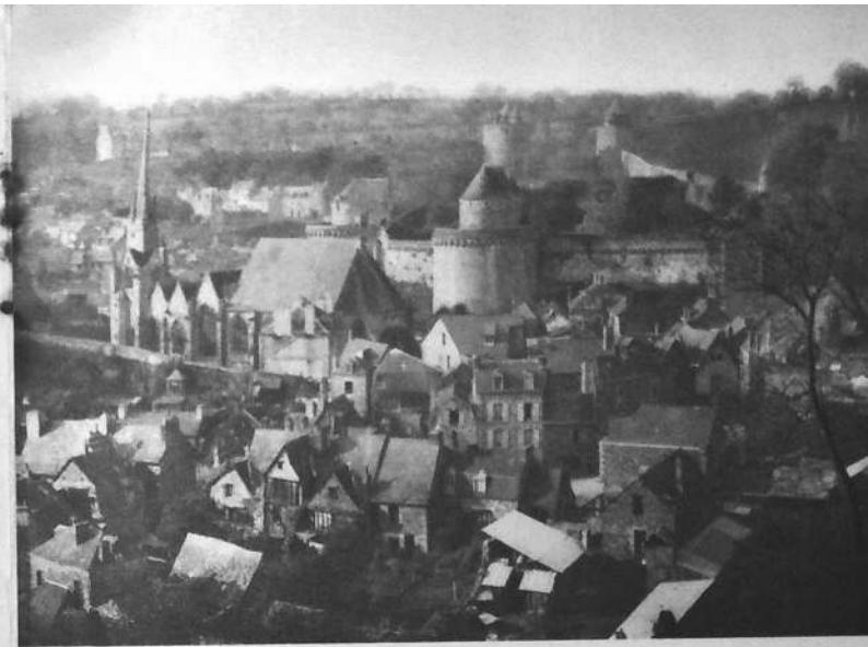
L'Eglise Saint-Sulpice, le château, le Marchix et ses vieilles maisons.