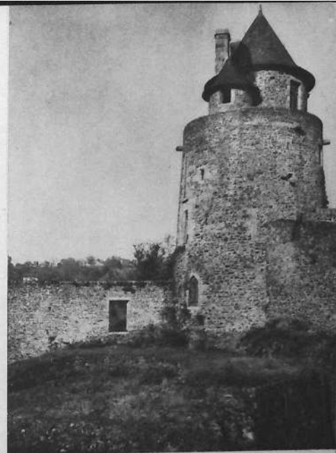
Ruines d'un donjon formidable rasé par le roi d'Angleterre en 1166 et mis à jour en 1934 par le Syndicat d'Initiatives.

Reliant la haute ville au château vers lequel elle dévale à pic, la