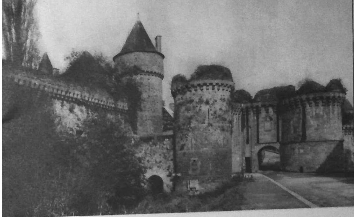
La Porte Notre-Dame.