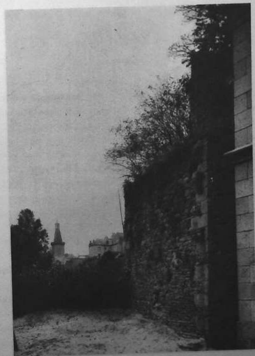
La Tour Papegaud et le Beffroi de la ville.

Délicieuses promenades aux environs immédiats de la ville.