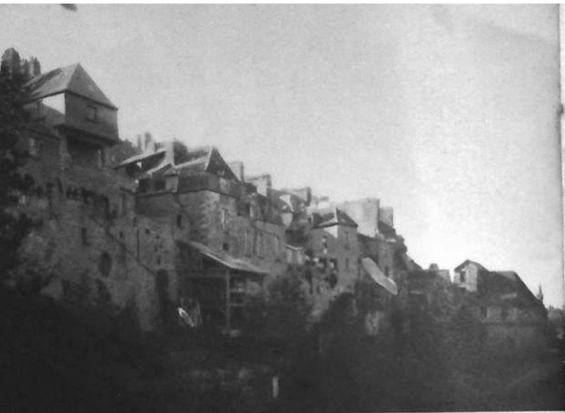
L'enceinte nord de la ville et la Tour Desnos.