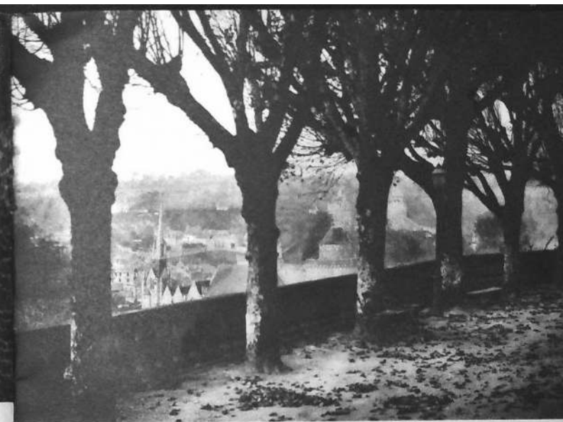
La Place-aux-Arbres (Jardin Public).

Admirablement situé, ce « belvédère incomparable », (site classé) est préféré souvent aux aspects réputés d'Avranches et Dinan pour la variété de son ensemble. Il domine toute la riante vallée du Couesnon capricieux et de son affluent le Nançon. Ici des carrières en exploitation, là des pignons pointus du XVI e siècle entourant la vieille paroisse au clocher qui penche, puis c'est le château lui-même