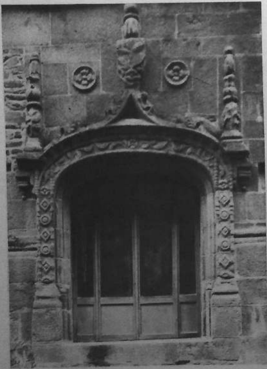
Porte Renaissance de l'Hôtel de Ville.