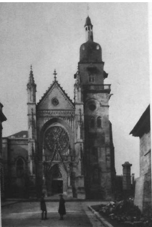
Façade de l'église Saint-Léonard.

et doré, belles statues de bois; puis les retables, en granit artistement travaillé, des deux autels du transept début et fin du XV e siècle), quelques bons tableaux et des vitraux récents. A l'extérieur, sculptures et gargouilles intéressantes, observer, dans l'ornementation de la jolie porte près du presbytère, l'image de la Fée Mélusine (emblème des Lusignan) peignant sa longue chevelure devant son miroir; clocher curieux (XV e siècle) à la flèche penchée, du fait d'un sorcier, dit la légende.