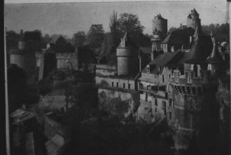
Une partie (sud) des fortifications de la ville.

jadis, la défense naturelle d'une ceinture d'eau profonde, il offre cette particularité peu commune d'être dominé par de hautes collines d'où le regard plonge en son enceinte.