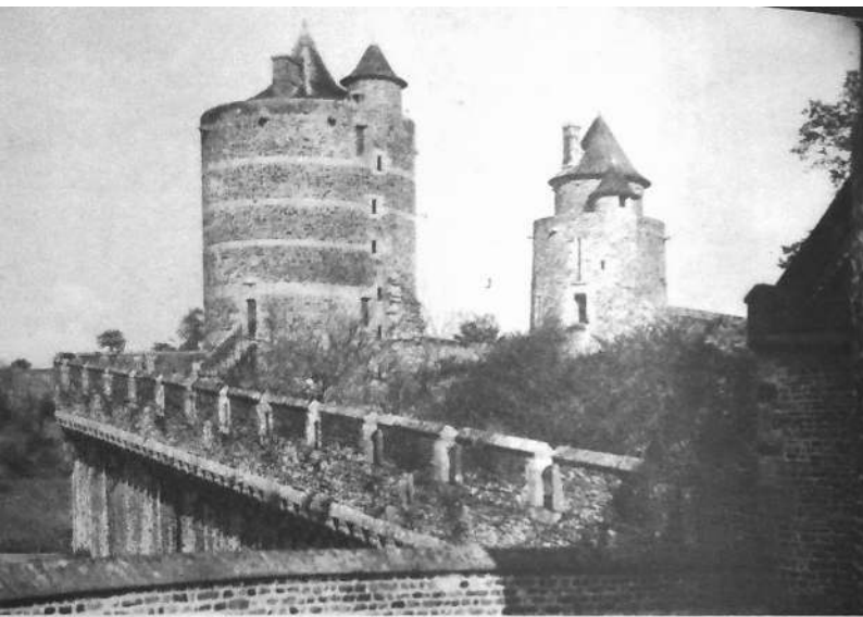
Cortine entre les Tours Surienne et Mélusine. Au fond, Tour des Gobelins.

curieuse rue de la Pinterie était jadis une ligne de remparts fortifiée sur chaque face. Au centre de ces vieux murs de ville, la tour Nichot est ouverte au touriste qui, de sa plateforme, aperçoit le pittoresque ensemble des habitations anciennes, toutes rongées de verdure, qui montent vers l'Est.