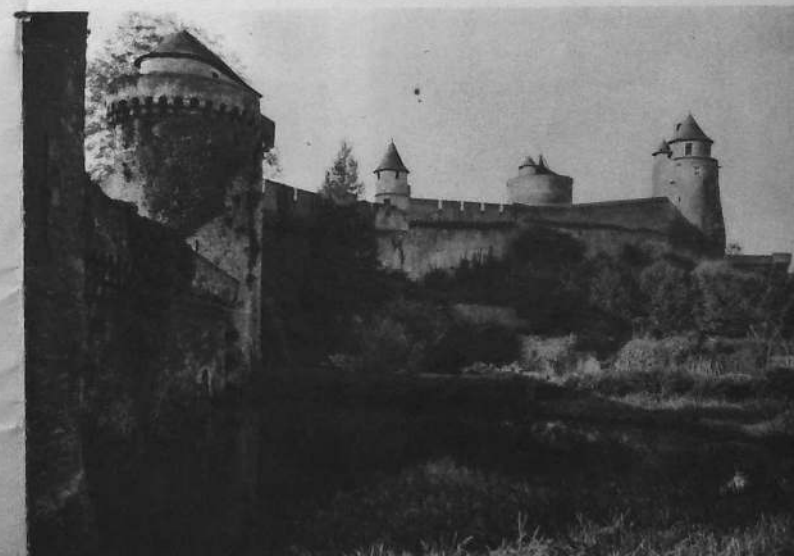
La cortine nord de la Tour Guémadeuc à la Poterne.

Sur toute cette partie de l'immense panorama, dans la direction du soleil couchant, le spectacle devient féérique, lorsqu'aux dernières