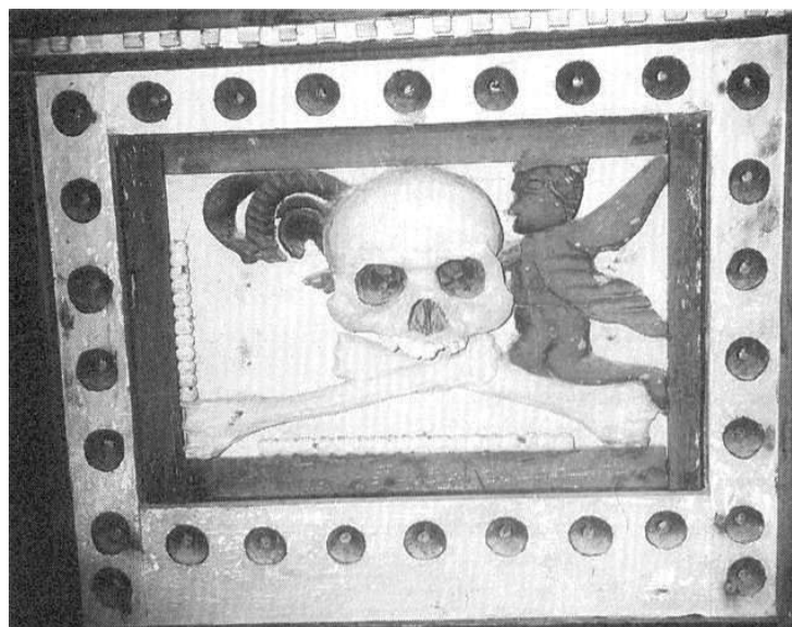
Saint-Gilles-Pligeaux : détail du catafalque