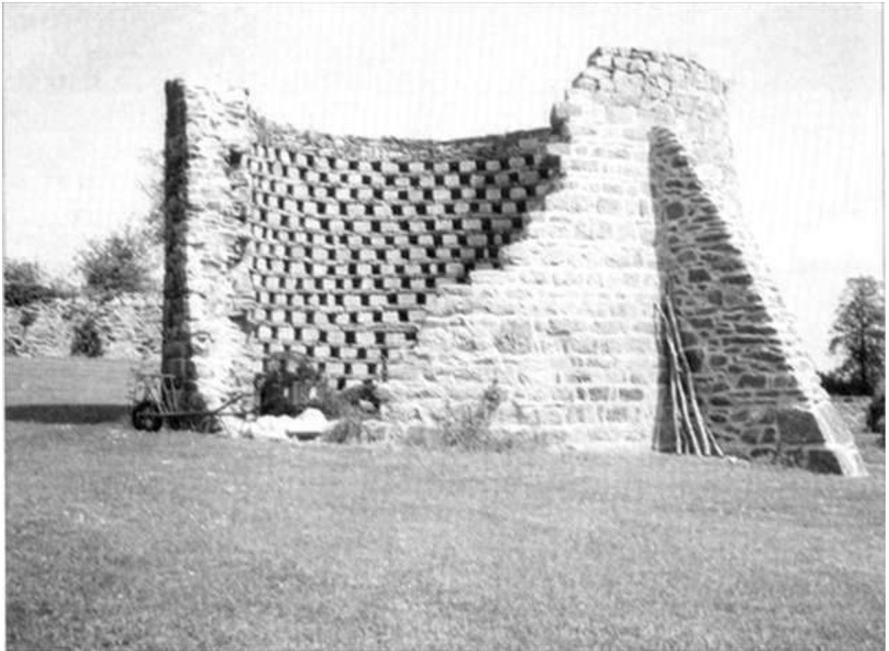
« Kertanguy » en Squiffiec : structure intérieure d'un colombier

Une carte de France, tracée lors d'une exposition à Rambouillet, dans les années 60, faisait concorder le nombre de colombiers avec la densité de culture du blé !