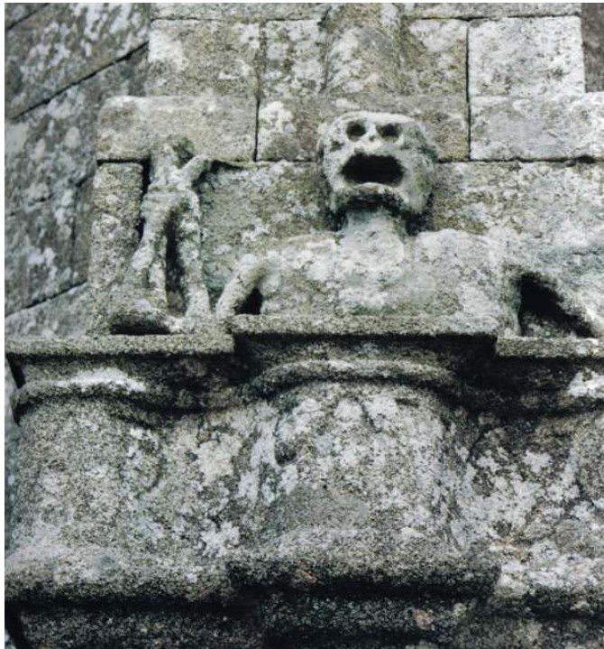
Spectre hurleur de la mort à Bulat-Pestivien