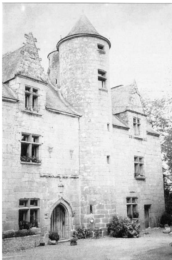
« Toul-an-Golet » en Plésidy : colombier sur la tour