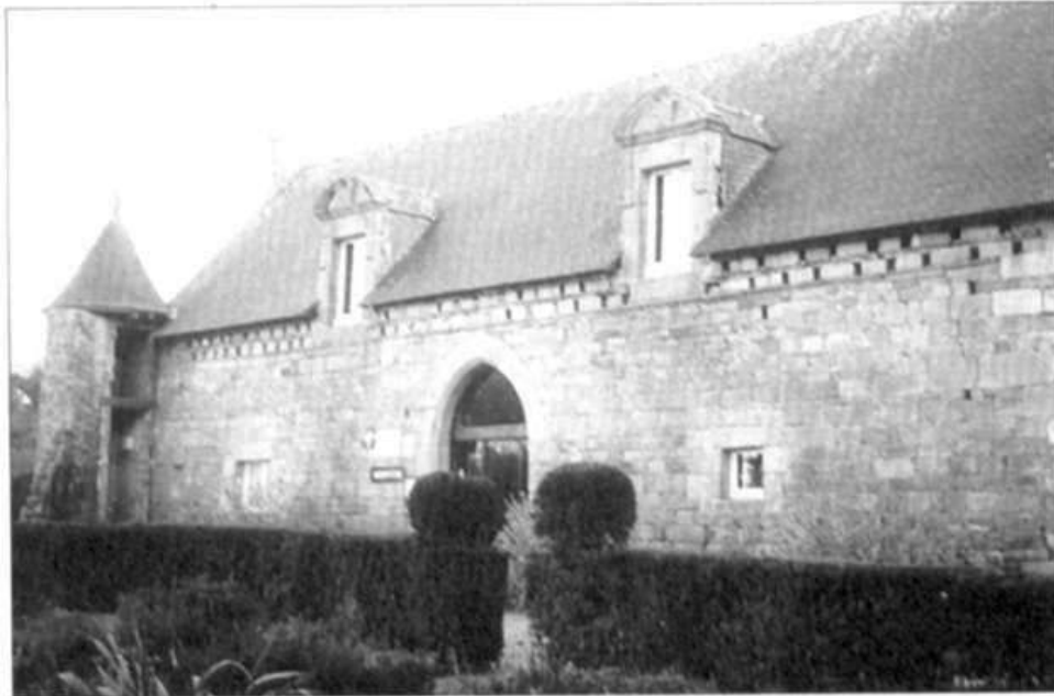
«Le Cleuziou» en Louargat : façade à boulins.

Le contenance moyenne du colombier breton est de 600 boulins, soit 1.200 pigeons.