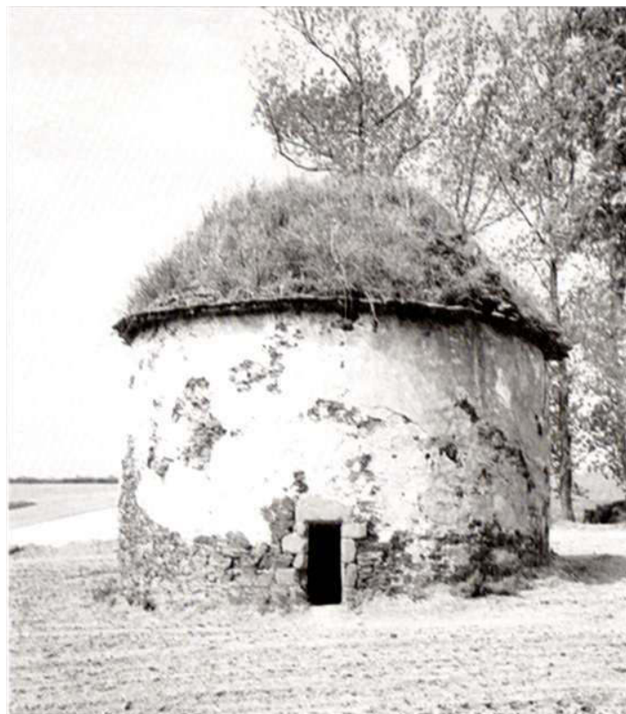
« Kermartin » Minihi-Tréguier : le plus ancien colombier Du Trégor et sans doute de Bretagne.

La nuit du 4 août 1789 vit l'abolition pure et simple du «droit exclusif de fuyé et de colombier». Depuis, les vieux refuges à pigeons ne sont plus que des épaves, témoins d'un état de choses périmé.