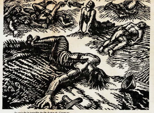
Un soir de la bataille de St-Aubin du Cormier. Voir l'imagier XV. Heals.

Un jour du monde, 150.000 florins pour Sigismond. L'ex-tisserand vient au secours de l'archiduc. Sigismond a promis de donner 150.000 florins à l'ex-tisserand pour le secourir.