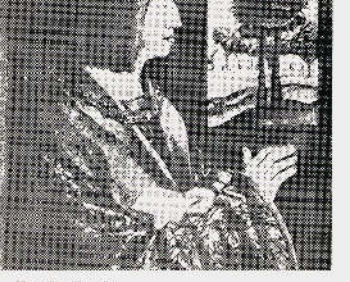
Année de Bretagne pendant le siège de Rennes.