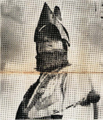
FRANÇOIS II ÉCHAPPE AUX FRANÇAIS RÉCIT DE LA BATAILLE (p. 2)

La rancœur si longtemps retournée, a rendu les combats d'une violence sans pareil. « Continuer la guerre dans de telles conditions... il ne faut pas y songer. Une seule et unique ressource si l'on veut éviter le désastre : la paix, la paix immédiate, l'indépendance du duché doit-elle en souffrir ». C'est la déclaration que le duc François II vient de faire au conseil; il envisageait de capituler pour sauver ses sujets.