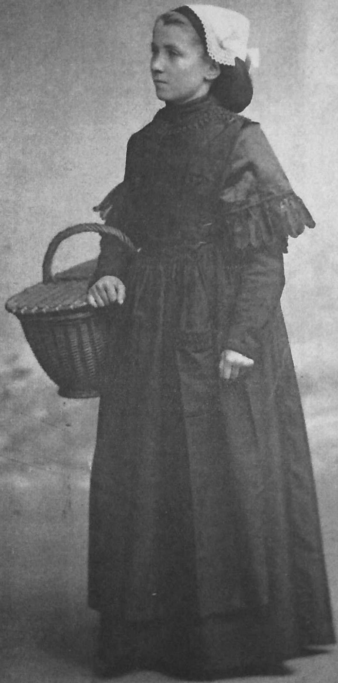
J. et V. Étude de Coiffes de Bretagne 1399. Jeune fille de Redon allant au marché