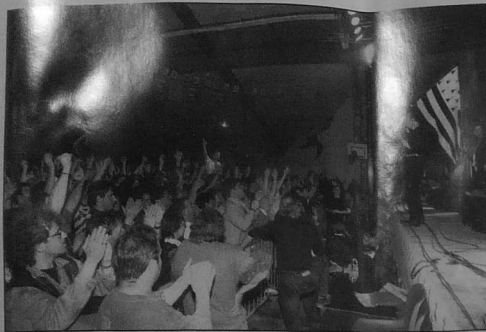
Alan Stivell Speled 1994