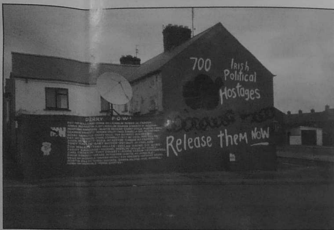
Quartier catholique de Derry (été 94)