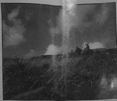
Vue des Monts d'Arrée.

3. Enfin, EMGANN réitère sa proposition de poursuivre l'étude de faisabilité pour le rehaussement du barrage et le talutage des berges, afin d'en accroître la capacité d'un tiers, ce qui éviterait la