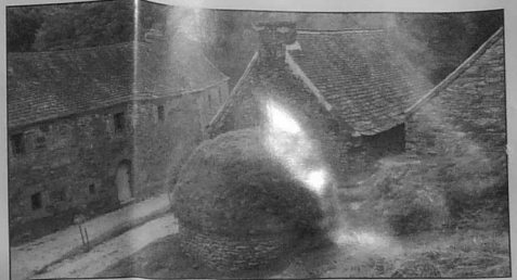
Le moulin de Karouat dans les Monts d'Arrée

La politique centralisatrice de l'Etat français va pleinement tirer partie de ces contradictions de la société bretonne. Ce jeu va se concrétiser dans la centralisation. Dans le sujet qui nous intéresse, cette politique va se matérialiser dans deux