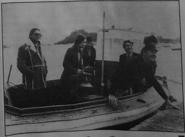
Indiaded Ojibway deud da welout «roudoù» laous Amoco e Trebeurden (1980)