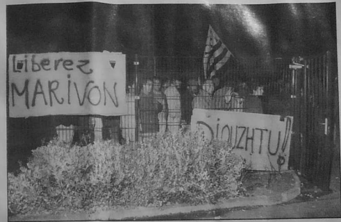
Manifestadeg e Lannion da zieubiñ ar Vretoned tamallet e-barzh aler an euskariz

Ar Smig da vetek ar marv ha netra ken!!! An nerzh kuzhet se zo un dra vat evidomp, evito, evit ar vro. An nerzh da larout nann pa vez ret.