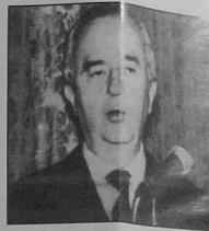
Balladur président et Delors 1er ministre, et le tour est joué !

Clons Delors : «Le dialogue est contaminé par un mal français. Rarement, les partenaires réussissent à s'en