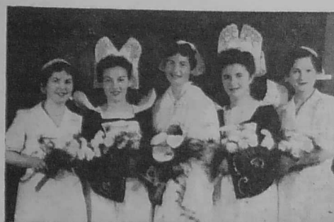
La Reine des « Filets Bleus » 1950 et ses Demoiselles d'Honneur

Filets bleus, filets bleus, à vous tout seuls... poème Et symbole et blason en votre fin réseau, En vos mailles ténues, restez toujours l'emblème De notre merveilleux petit port : Concarneau.