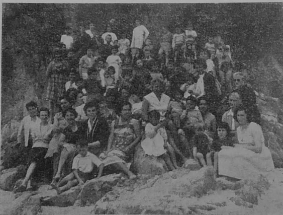
Sortie de l'Heure d'Amitié du quartier de l'Hippodrome du jeudi 16 Juin 1960, à Beg-Meil.

Réflexions qui nous firent revivre les heures passées ensemble, et aussi désirer de nous retrouver toutes.