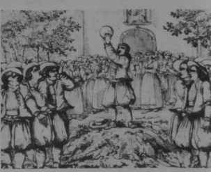
Ar vellad a oa ur sport-brudet-bras ar ar maez...