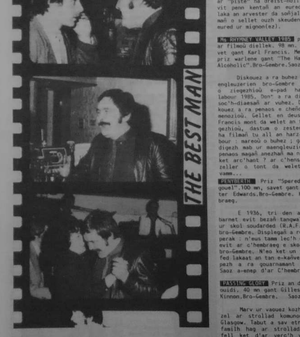
Ar prizioù : Ar maout gant Bro-Gembra...