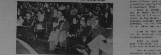
STARTAT AR STOURM