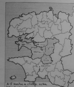
Ar 5' kantin a c'helle ar va... Kastellin