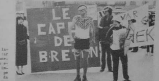
AR C'HAPES... HA GOUDE ?