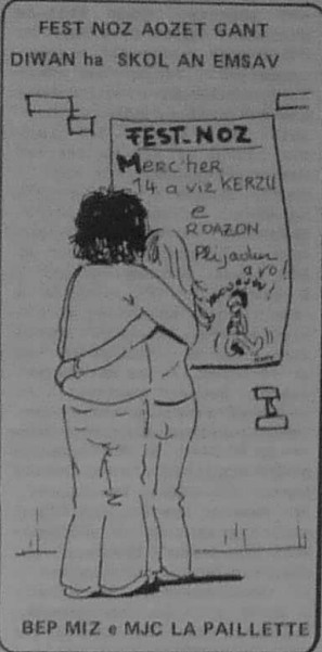
FEST NOZ AOZET GANT DIWAN ha SKOL AN EMSAV BEP MIZ e MJC LA PAILLETTE