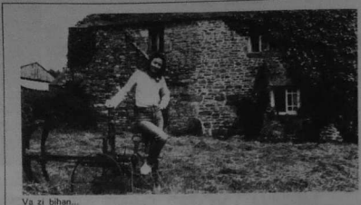
Va zi bihan...