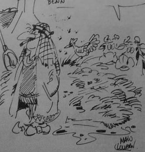
Ar c'hreiz ar c'hreiz eo omp... dant a-bez da vevel an ardiviz... dant a-bez da vevel an ardiviz...