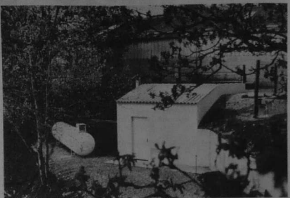
Ar c'hreiz ar c'hreiz eo omp... dant a-bez da vevel an ardiviz... dant a-bez da vevel an ardiviz...