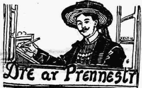
Pesketaerien Breiz er Maurtant

ON TRAITE A FORFAIT Nos annonces sont reçues par les Agences de Publicité et à nos Bureaux. Les manuscrits ne sont pas rendus.