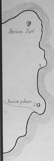
le île d'Hœdic

Sur le bord de la côte, un peu au Nord-Est de l'ancien phare, j'ai remarqué des débris de cuisine, et, parmi ces débris, j'ai trouvé un bel éclat de silex (16 octobre 1883).