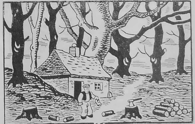
Yannik en deus kollet e votez... e pelec'h eman ?