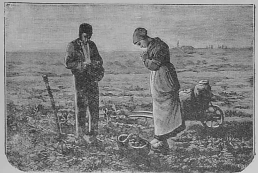
Ha gant ar gliz-noz e kouez war an douar, bennoz ar baradoz.

Salver Jezuz, c'houi hag a garie komz alies, en ho prezegennou, eus labouriou an douar, grit eur sell a vadelez ouz maeziou hor bro.