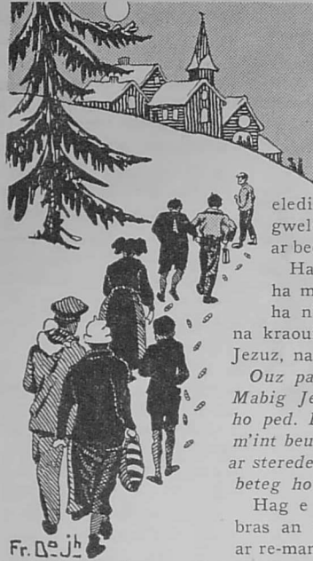
Fr. De Jb

Kaout a rae d'in e oa dija digouezet noz Nedeleg hag en doa Doue roet d'in diouaskell skanv evel re an alc'houeder, hag e saven en er uhel uhel... evit klevet gwelloc'h kan