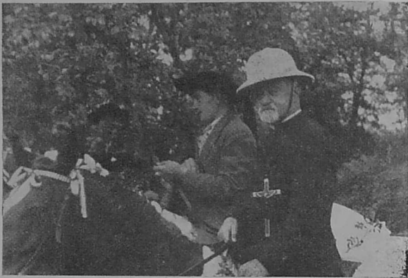
An Tad Quinquis, war varc'h e penn ar prosesion.