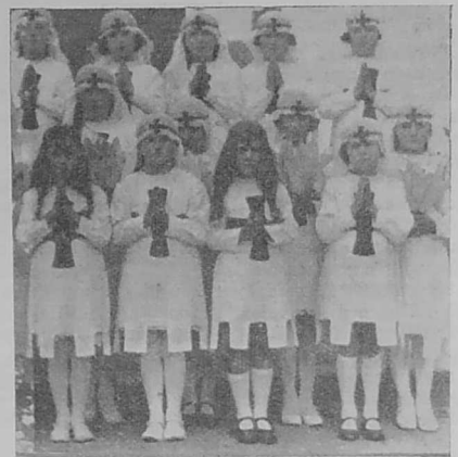
Ar « groazidi » a bedas ken c'houek epad ar mision. Bennoz Doue d'ezo