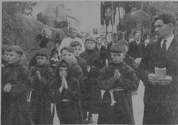
Ar « gapusined » vihan....