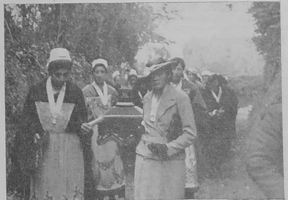
Bugale Mari o tougenn skeudenn ar Werc'hez, o mamm ha patronez