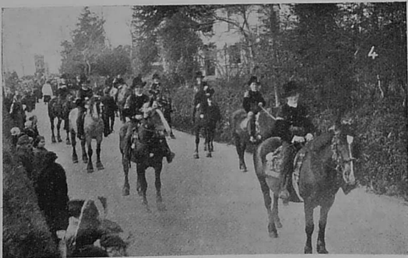
Ar « glaziged » war loan, o tigiñ hent d'ar prosesion.