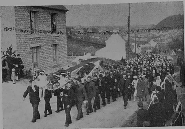
Ar wazed o tougen ar C'hrist bras.