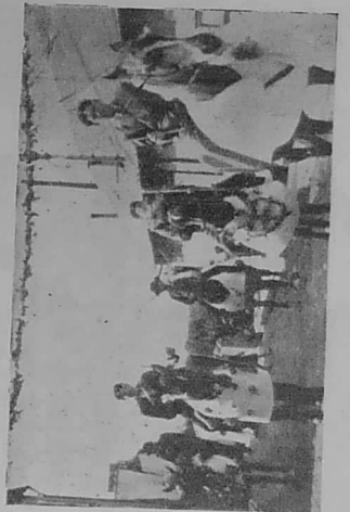
Ar baotred yaouank war loan e penn ar prosesion.