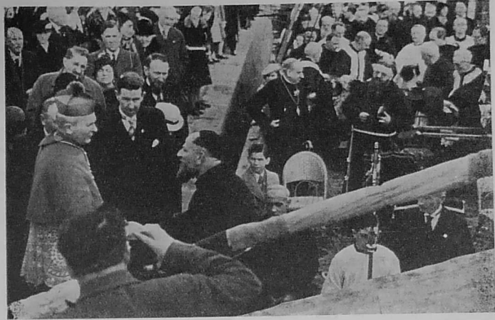
An Ao. 'n Eskob o venniga bag an Tad Yvon