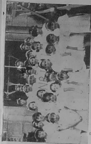
Ar vugaligoù a zougas binvioù ar Basion