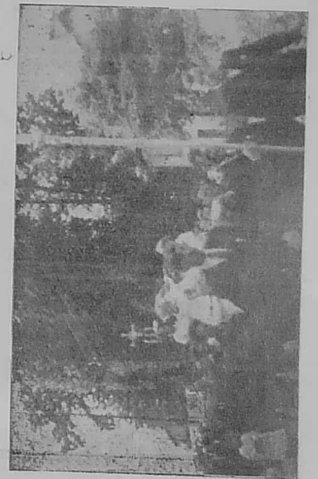
Ar gwazed o tougen eur C'hrist eus ar gaera, roet da Bont ar Veuzenn gant Ao. Person Sant Segal.