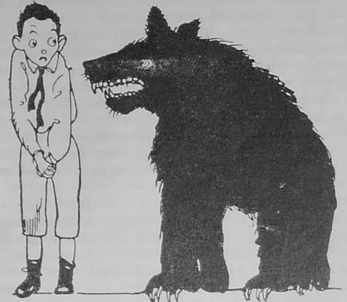
Ar skol dizoue a zo eur bleiz kriz prest da lonka hor bugale.

An deskadurez a zo eun dra ret en hon amzer. Setu ma kaser ar c'hrouadur d'ar skol an abreta ma c'heller. Plijadur am eus o welout paotred ha paotrezed o tont a-vandennou, drant ha seder, o bouteier nevez o pigosal stank war an hent bras. Ha koulskoude e vezan trist, trist, pa sonjan da beseurt skol ez eont; pa sonjan er parrezioù n'eus nemet skolioù dizoue enno.