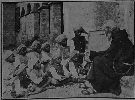
Oc'h ober katekiz d'ar baganed vihan.

Ar mel-c'hoed, gouzout a rit, a vez debret gant an tousegi. Diouallit Mac'harit. PETROMIK.