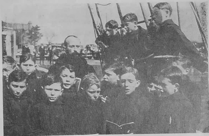
Kurusted bihan skol an Tadou Kapusin e Dinard, o kana war al lestr.