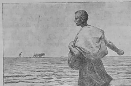
Eun den a yeas d'ar park evit hada...

« Selaouit, emezan; eun den a yeas d'ar park evit hada. Epad ma hade, lod 'eus ar greun a gouezas hed a hed an hent, hag a voe flastret dindan an treid ha debret gant laboused an nenv. Eul lo-