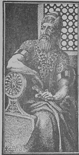
Ar Roue Herodez

Herodez a oue nec'het-bras ouz he c'hlevet o c'houlenn an dra-se. Koulskoude, dre m'en doa