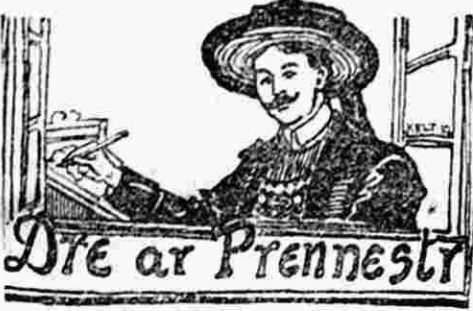
Ar Gredsted Du

Eur miz zo pe zaon, tommerien ar gweluriou-dre-dan en Pariz a oa 'n em lakeet en grév.