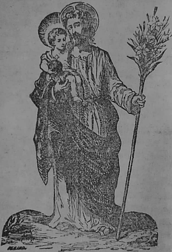
SANT JOSEPH, PATRON AR MARO MAD PEDIT EVIDOMP !

O velet ma cressk bemde ar fizianz ho deuz ar gristenien e scoazel sant Joseph, pried ar Verchez Vari, evit caout digant- han ners ha sikour, hon Tad Santel ar Pab Pii Nao en deuz selaouet goulenn calz a dud devot hag en deuz roet, dre eul lizer, an daouzek a vis Gouere 1864, eun induljanz a dri c'hant devez bemde da beb christen mad a rai epad ar mis ar pez a zo merket el levr skrivet e Rom ha galvet :