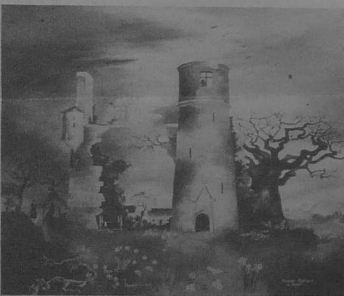
LA LEGENDE DE RUSTEIAN, 1890 Huile, 71 x 60. Musée municipal Pont-Aven