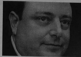
Bart de Wever, Prezidant an N-VA

Biskoazh ne oa bet Flandrez ken tost ouzh ar frankiz. E dilennadegoù kevredadel Belgia 2010 en deus tapet an Nieuw Vlaamse Alliantie (N-VA) 29,5% eus ar mouezhioù ha 27 kannad e Parlamant ar stad. Un aradkadenn spontus, pa ouezer e oa bet krouet ar strollad-se e 2001 goude dispari ar Volksunie ! Aet eo e zisoc'hoù war gresk atav, ha bremañ eo Bart de Wever, prezidant an N-VA, mestr ar vro. N'eus ket pell zo e oa bet ret d'an N-VA kaout un emglev gant ar CD&V, ar strollad mirour flandrezat. Bremañ int kalz kreñvoc'h evit o c'hevredad kent. Ha penaos e c'heller dielfennañ an darvoud meur-se, ha penaos ober hor vad dioutañ ?