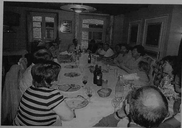
Le traditionnel repas de la fédération d'Ile et Vilaine du Parti Breton s'est déroulé le 18

juin à Lohéac. A cette occasion des militants de Redon se sont joints à ceux de Rennes.