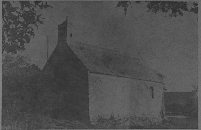
Theix. Chapelle de Calzac-Eglise (en cours de restauration)

A l'initiative de Breiz Santel, des jeunes volontaires, des Vannetais et la population du quartier ont mené à bien pendant l'été et l'automne 1977 les premiers travaux de sauvetage de ce charmant édifice solidement planté à flanc de coteau. Il faut maintenant restaurer l'autre pente de la toiture et remettre en valeur le beau mobilier intérieur (retable, statues, armoires et originale table de communion).