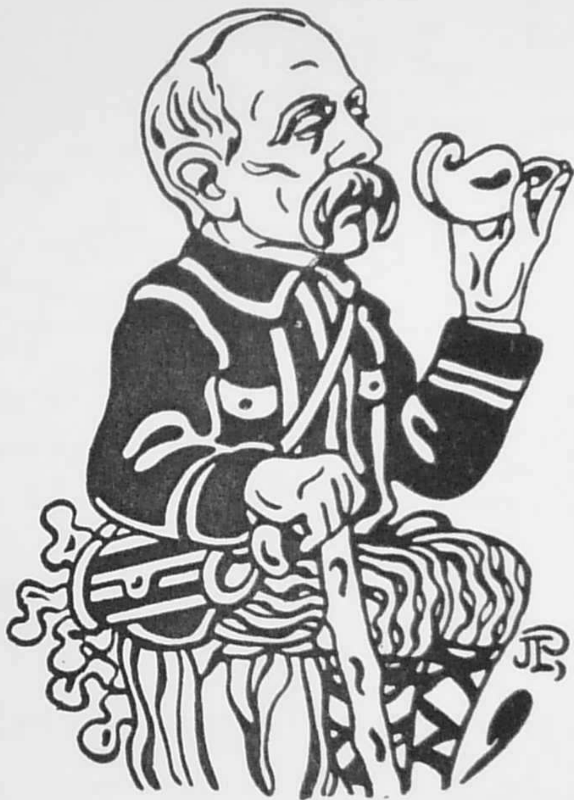
Dessin de Jac. Pohier