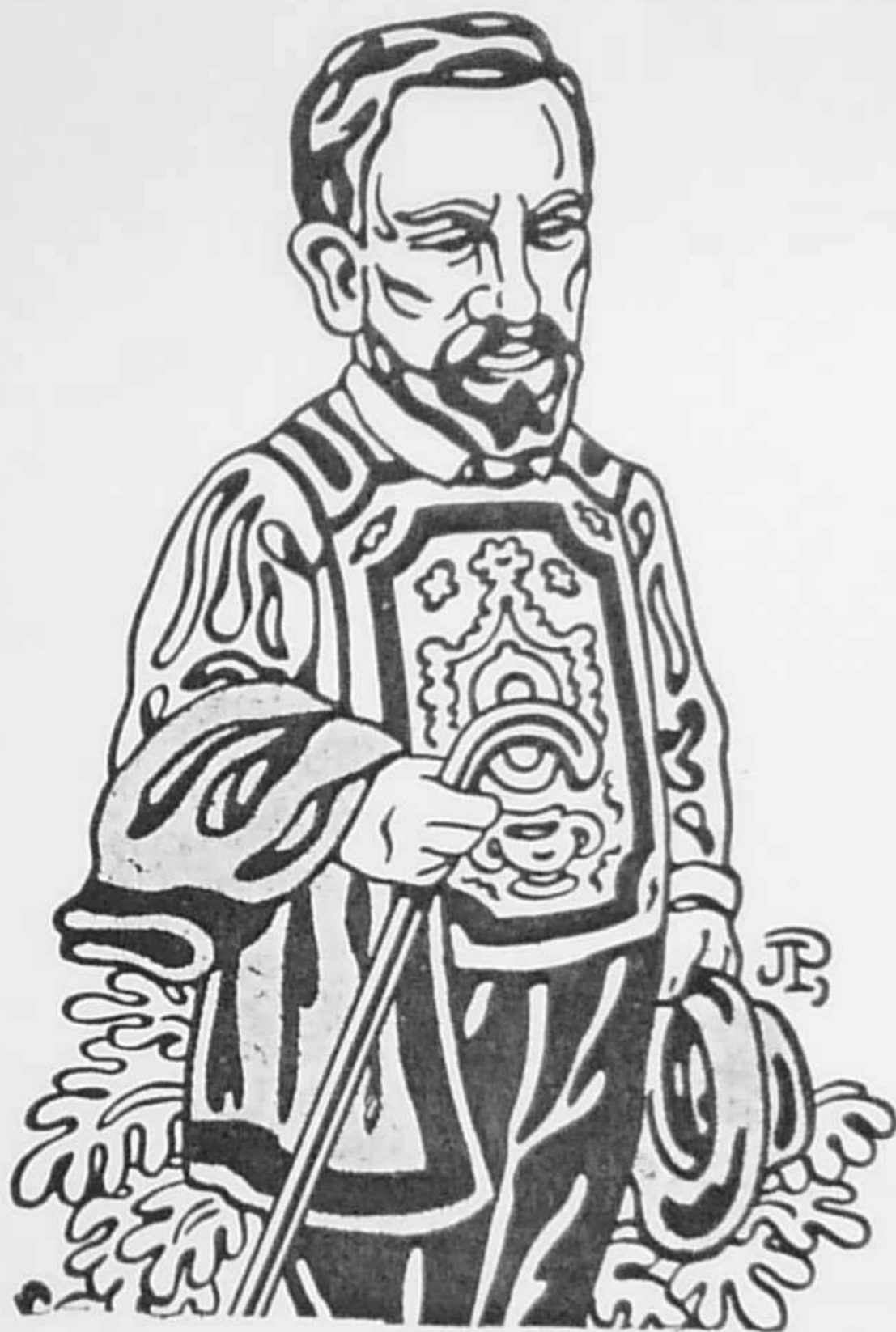
Dessin de Jac POMIER.