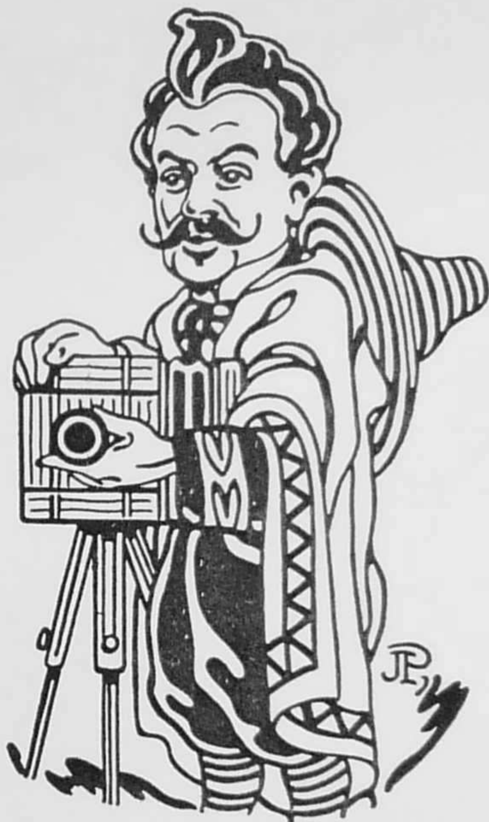
Dessin de Jac. Pohier.