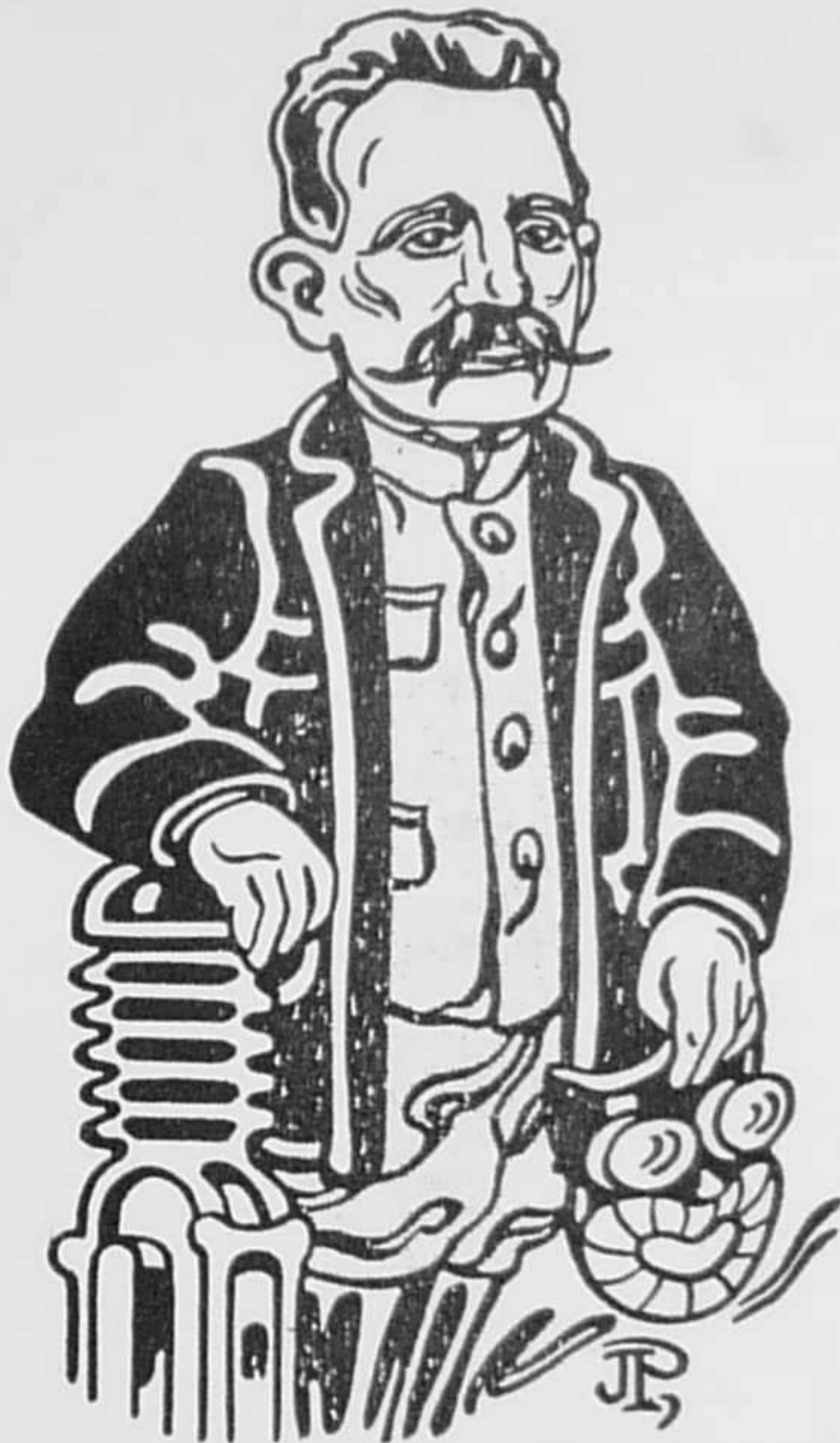
Dessin de Jac. Pohier