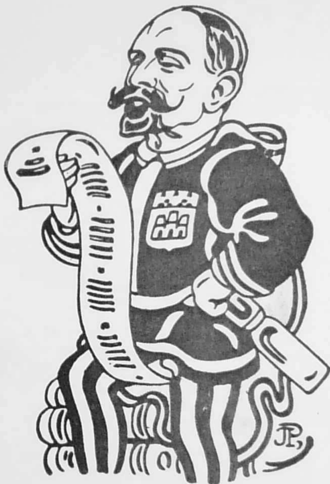
Dessin de Jac. POHIER.