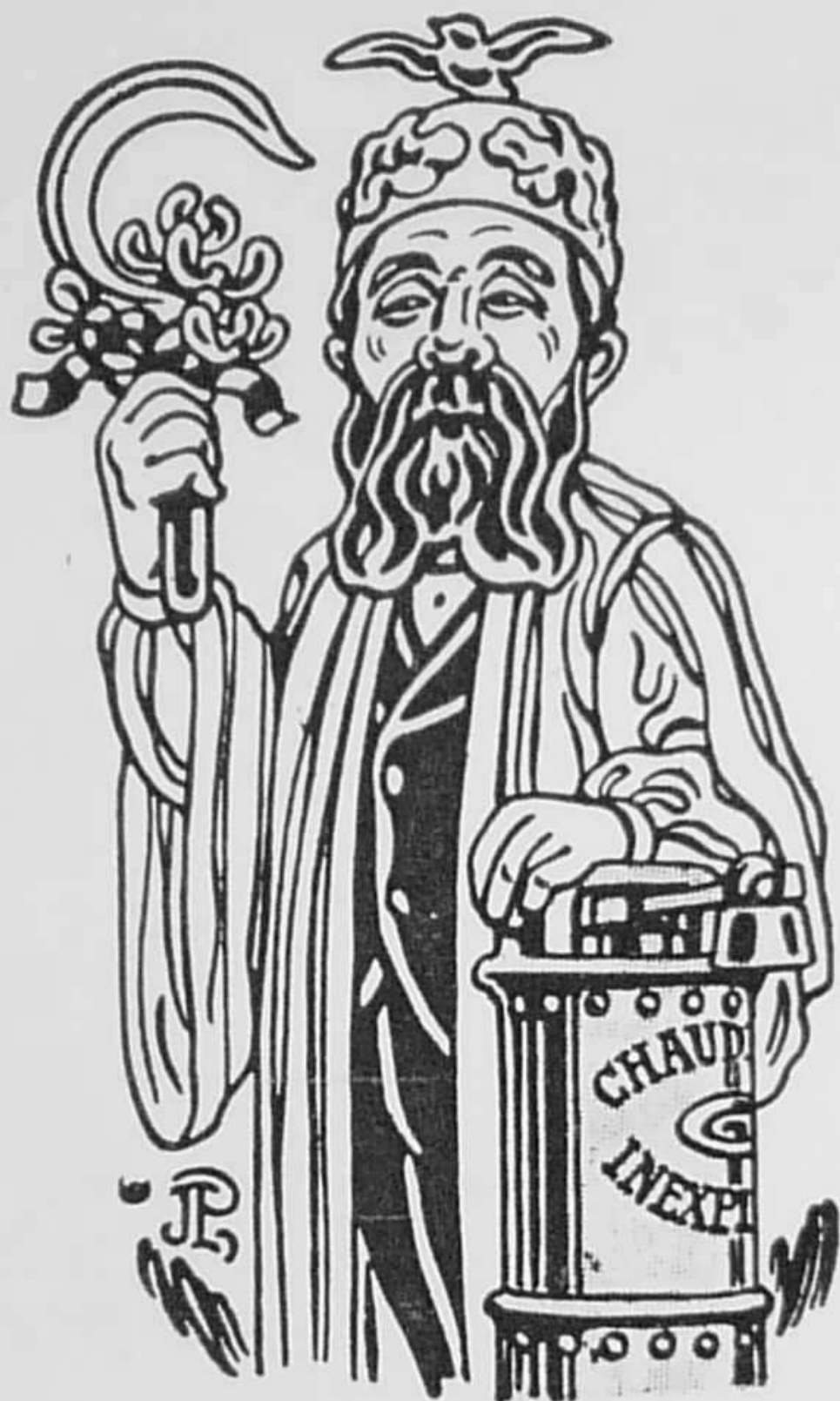
Dessin de Jac. Polier