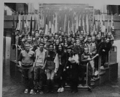
Au Parlement Européen

À leur retour, les jeunes ont eu pour mission de produire un magazine web avec des articles, des photos et des vidéos illustrant ce qu'ils ont retenu du séjour. Sur les quatorze revues réalisées, quatre ont été sélectionnées et soumises au vote de l'ensemble des élèves de 3 e , des parents et des enseignants. Le projet vainqueur est à découvrir sur http://joom.ag/shkp .