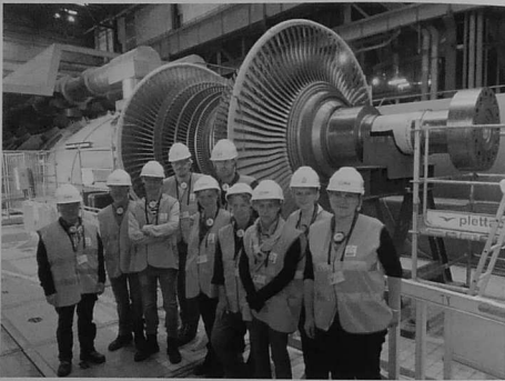
Visite des chantiers dédiée aux riverains le 28 mai 2015