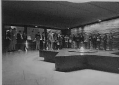
Au mémorial de la Shoah