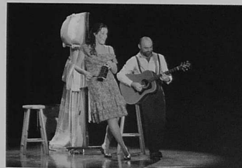
Comptes à Rebours