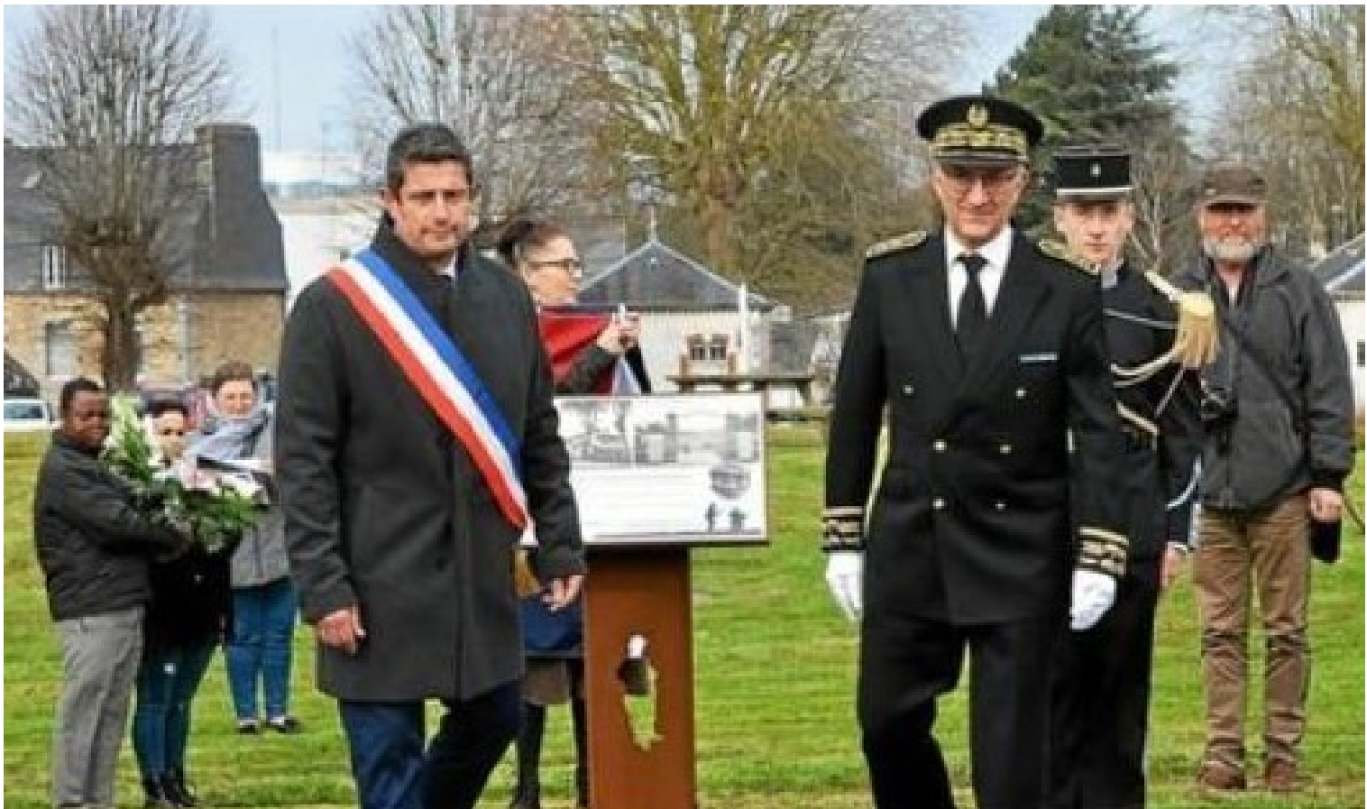
Pupitre mémoriel qui sera placé à l'entrée du campus universitaire.

Aujourd'hui, en ce 9 mars 2022, nous commémorons le souvenir des officiers, sous-officiers et soldats, qui fidèles à la devise du régiment : « Dur comme Roc » ont combattu pendant la campagne 1939-40, dans la Résistance et pour la Libération. Oui, à chaque fois qu'un conflit se met en œuvre, à chaque fois c'est une épreuve et se sont les hommes et les femmes qui paient le prix. Alors, aujourd'hui, en nous inclinant devant la mémoire des soldats du 48 ème RI, tombés au printemps 1940, nous soulignons le sort de ces hommes ; qui, le jour J sont entrés dans l'histoire, pour nous permettre de la prolonger. Cette cérémonie, nous rappelle aussi à nos devoirs pour porter secours à l'humanité souffrante parce que nous le devons à la mémoire de ceux qui sont morts pour nous.»