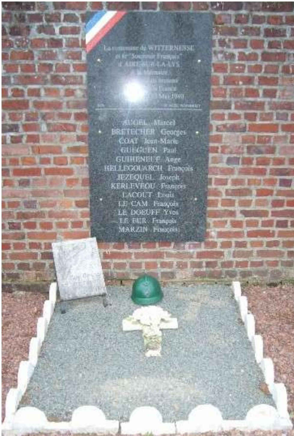
Plaque commémorative des 13 soldats bretons tués à Witternesse