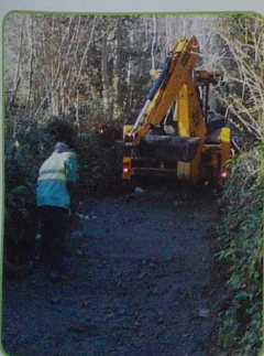
Courant janvier, les services techniques ont procédé à la remise en état du sentier de Stang Kerlek.