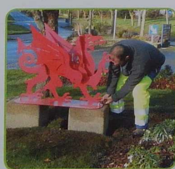
Le dragon rouge offert par les amis gallois à l'occasion du 30 e anniversaire du jumelage a été installé sur le rond-point de Cymych par les services techniques.