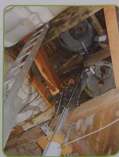
Les sommiers de la partie supérieure du beffroi ont été remplacés par la société Art Camp, de Pommeret (22).