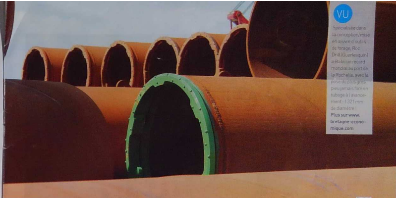
VU Spécialisée dans la conception/mise en œuvre d'outils de forage, Roc Drill (Guernesquill) a établi un record mondial au port de la Rochelle, avec la pose du plus gros pieu jamais foré en tubage à l'avancement : 1,327 m/m de diamètre. Plus sur www.bretagne-economique.com