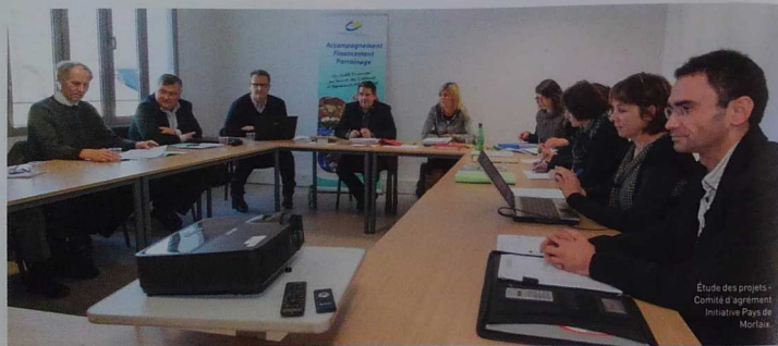
Étude des projets Comité d'agrément Initiative Pays de Morlaix

Initiative Pays de Morlaix et Initiative Cob proposent aux entrepreneurs un nouveau prêt d'honneur : le prêt croissance. Avec le soutien du fonds d'intervention d'urgence de la CCI Morlaix.