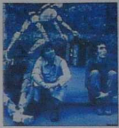
La Rue Katanou le samedi soir...