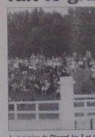
Le jumping de Dinard, les 3 et 4 août.

Pour la 20 e année consécutive, le centre accueille un jumping international. Ce concours de sauts d'obstacles est l'occasion de voir à l'œuvre les meilleurs cavaliers et les plus belles montures, venus d'une vingtaine de pays. Rendez-vous du 3 au 4 août. "Que l'on soit jeune ou vieux, que l'on monte ou pas, c'est toujours un magnifique spectacle plein de rebondissement", raconte avec ambages François Marolle, l'un des organisateurs de la Société Hippique de Dinard. Plus de 80 cavaliers et 200 chevaux sont attendus pendant les trois jours. Le jumping fête l'édition internationale: on y verra des Français bien sûr, mais aussi des Européens, des Australiens, des Japonais... Même le Zimbabwe et le Porto-Rico seront représentés. Les