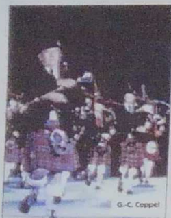
Les pipe-bands écossais assurent toujours le spectacle.

Le Festival Interceltique, fondé en 1971, est devenu le grand rassemblement des créateurs des pays celtes. Chaque année, 3 500 d'entre eux convergent en août vers Lorient, venant d'Écosse, d'Irlande, du Pays de Galles, de l'île de Man, de Cornouailles, des Asturies, de Galice et de Bretagne, mais aussi du monde entier. En dix jours, 500 000 spectateurs découvrent toute la richesse de la planète celte.