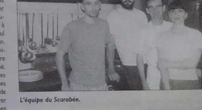
L'équipe du Scarabée.