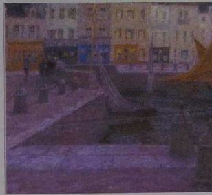
"Le musée, le Croisic", huile sur toile d'Henri Le Sidaner réalisée en 1923.

Trente-cinq œuvres, dont trente-huit sur toile, ont fait le voyage jusqu'à Pont-Aven, venues pour la plupart de collections privées et de musées américains, canadiens et britanniques. Là-bas, Henri Le Sidaner (qui signifie en breton le marchand de soie) s'est fait un nom. Le peintre se devait cet état dans la petite cité artistique du Finistère pour revivifier son parcours breton. C'est en 1913, à 51 ans, qu'il décide de rejoindre la terre de ses ancêtres "pour y travailler".