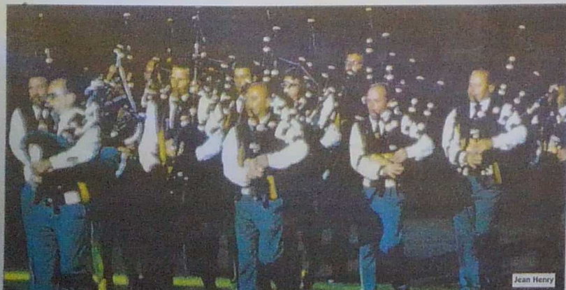
Pendant la nuit des cornemuses...

Le conseil d'administration a donc tranché: la grande parade sera gratuite sur la majorité de son parcours et payante dans les tribunes du stade du Moustoir. Des tribunes qui pourront accueillir 10 000 personnes, alors qu'entre 30 000 et 40 000 spectateurs sont attendus au total.