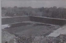
Dans les Monts d'Arrée, il n'est pas rare de découvrir ce type de fosse, creusée à moins de 50 mètres d'une rivière, sur un terrain en pente. L'abattoir Tilly-Sabco y stocke des boues de station d'épuration avant épandage.