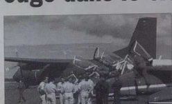
La Patrouille de France fera son show à Perros-Guirec samedi 3 août.