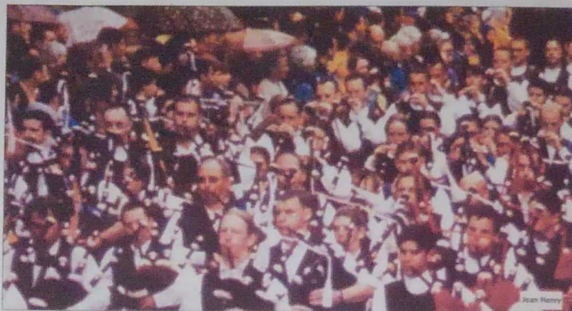
La parade des nations celtes: toujours un grand moment!

À commencer par la cotriade au port de pêche, vendredi 2 août, animée par des chants de marins autour de la gastronomie de la mer.