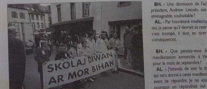
SKOLAJ DIWAN AR MOR BIHAN

Diwan aujourd'hui... Les écoles Diwan, dont l'enseignement est assuré par immersion, sont à dire que le breton est la langue d'enseignement et de vie à l'école. Elles comptent aujourd'hui 2800 élèves. La première école Diwan a été créée en 1977 et la première promotion Diwan a passé son bac en 1997, après avoir suivi sa scolarité dans le lycée unique, aujourd'hui à Carhaix. Les écoles Diwan sont gérées par les familles. Elles jouissent, jusqu'à maintenant, d'un statut d'enseignement privé, comme les écoles confessionnelles, tout en se situant laïque.