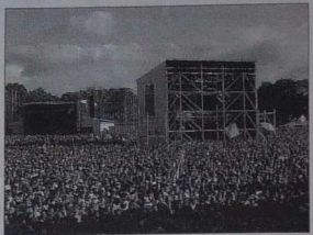
La foule devant la grande scène des Viellies Charrues.