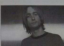
Neil Hannon, leader du groupe Divine Comedy qui distillera son pop "lymphatique" au soir du 9 août.