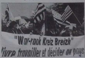
"Vivre, travailler et décider ou payer", un vieux slogan autonomiste toujours d'actualité et très dans l'air du temps.

« L' à dimension politique de la question (INDL) bretonne est gérienne. L'ement mise sous le boisseau. Les Bretons craignent un retour des vieux démons. Pour l'instant, ils vivent leur bretonité de façon émotionnelle, mais pas de façon rationnelle, de peur de remettre en cause le pouvoir de l'État. Ils ne possèdent souvent le mot "autonomie", par exemple, car ils le confondent avec l'indépendance, et même autarcie. Pourtant, l'autonomie peut être une solution nuancée et viable pour l'avenir des relations entre les peuples un peu partout sur la planète. La question mériterait au moins d'être débattue. Il est temps de répondre à ces questions de société, de démocratie, à un moment où nous sommes en pleine crise de représentation politique. La population attend qu'on lui propose de grands projets. Ainsi s'exprime le Telegramme (mercredi 24 juillet 2002), lors d'un entretien consacré à l'identité bretonne.