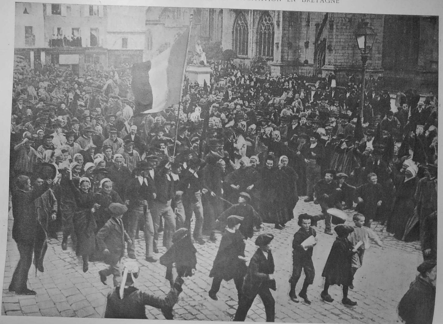
LA MANIFESTATION, DITE DES CANTONS, SUR LA PLACE DE LA CATHEDRALE, A QUIMPER