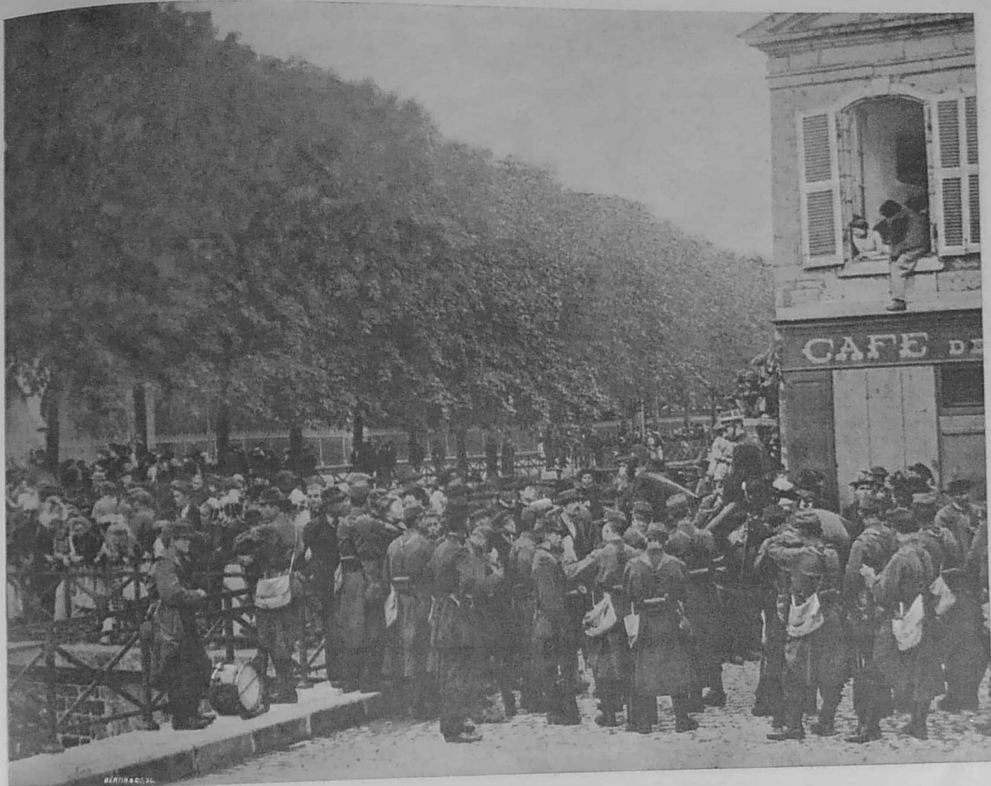
L'ÉTAT DE SIÈGE A QUIMPER. — LA PRÉFECTURE GARDÉE PAR LA TROUPE