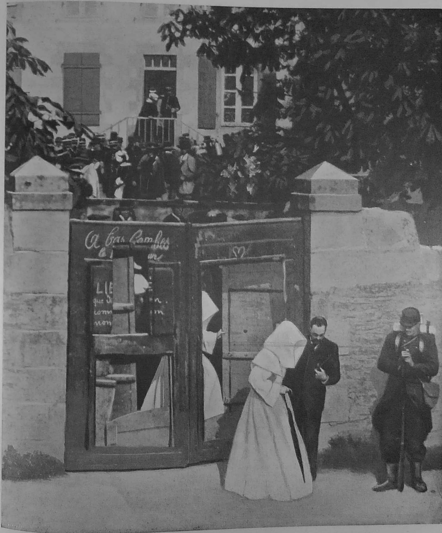
LES "SOEURS BLANCHES" QUITTANT L'ECOLE DE BRASPARTS, APRES LES OPERATIONS DE POLICE

L'EXPULSION DES SOEURS ET L'AGITATION EN BRETAGNE