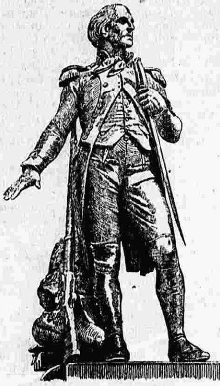
Bers, Laz, h' Librente. Grlou lavaret gant An Tour d'Arvion

LIZER DIGOR D'AN AOTROU KONT A LAIGUE pere'hen maner Bahurel, e-tal Redon