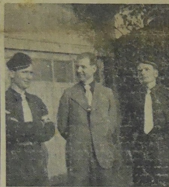
Le Chef du Parti s'entretient avec deux Volontaires de nos Organisations de Jeunesse

Revenons aujourd'hui sur les comptes rendus d'activité des Chefs départementaux. Ces comptes rendus eurent lieu au début de la séance du matin, l'auditoire à suivi, avec intérêt, ces divers exposés ou se retrouvaient les résultats acquis après un an d'action patiente et de prospective minutieuse.