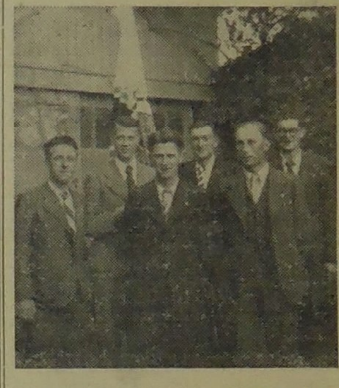
La délégation de Châteaulin

Je sais quelqu'un dont les oreilles ont violemment tinté cette semaine de reproches venus de tous les horizons bretons : c'est tout simplement le rédacteur en chef de l'Heure Bretonne. Car, voyez-vous, ce « Monsieur » croyait avoir gentiment fait son travail : bonne manchette, double titre sur six colonnes, un montage photographique avec triskel symbolique en belle première page, commentaires ad hoc sur le caractère « miracle breton » de la journée du sept septembre, compte-rendu dépouillé de superlatifs et découpé avant des divers discours pour produire deux pages de texte. Et tout cela après avoir été copieusement dérangé pendant plusieurs jours par d'enthousiastes et indiscrets congressistes !