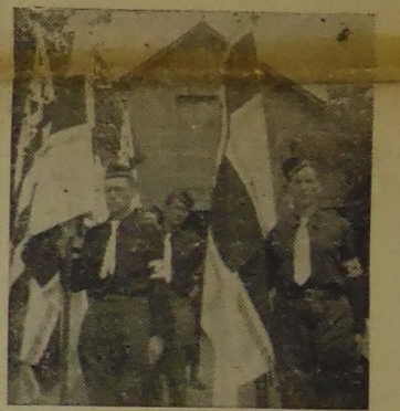
Porte-drapeaux Au 1 er plan : les drapeaux de la Jeunesse Bretonne (Blanc, croix noire, triskel jaune et bandes bleues)

tupérial et coloré, vous nous sortez un compte-rendu objectif et prudent, comme si vous n'étiez pas de la maison ! Seriez-vous donc le seul parmi nous tous qui n'ayiez pas ressenti toute la grandeur, toute l'importance, tout le côté révolutionnaire de ce Congrès ?