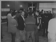
Elus et associations

Une rencontre élus-associations a eu lieu le 18 octobre 2003, à la Tannerie. Cette soirée conviviale avait pour objet d'offrir aux représentants de la municipalité et du milieu associatif un temps d'échange devant permettre de cerner les attentes et contraintes de chacun. 109 personnes représentant 28 associations avaient répondu présentes.