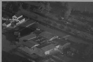
Parking de la Maison de l'Enfance

dans le nouveau plan du Loroux-Bottereau permet aux Lorousains, comme aux personnes extérieures à la commune, de repérer facilement ce nouvel accès