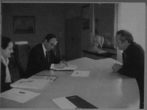
Signature du contrat avec Dexia

Ce document constitue une ligne directrice sur les équilibres financiers et les projets en matière d'investissements pour la durée du mandat. Ce plan n'est en aucun cas figé, il doit permettre aussi de répondre à des besoins nouveaux et évoluer selon le degré de réflexion des projets retenus, avec pour exemple la construction de la Maison de l'Enfance, ou l'Espace de la Gare. Les grands équilibres initiaux sont respectés, à savoir que le volume d'en-