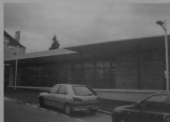
Parking de la médiathèque