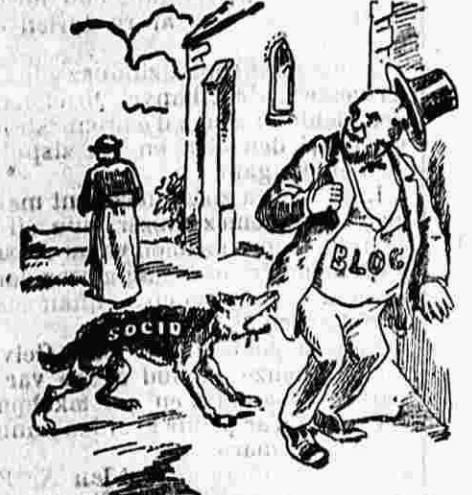
An Aotrou Blokard. — Oiaou!! Ar belek e d'ad krigeri ennan, ha n'ê het ennon-me! O gast! Klavê e sur, n'ave ren e'hanon...