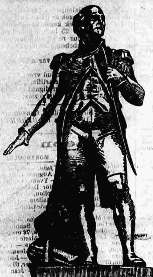
«Bars, Loez, ha Librente.» Giriou laerel gant AN TOUR D'AUVERGNE