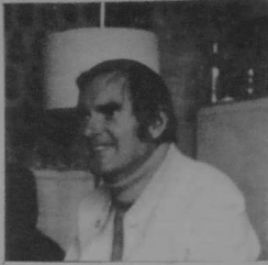
Per ar Bihan

PV — Anavezet eo AL LIAMM gant kalzig a dud bremañ e Breizh pe d'an nebeutañ, e-toues ar re a ra war-dro ar brezhoneg pe a zo dedennet gant ar brezhoneg. Med ar pezh ne oar ket kalz a dud marteze, eo pe da vare, pegoulz, ha gant ploc'h eo bet savet AL LIAMM ?