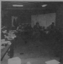
Tud U.D.B. o studiñ en Naoned

Diouzh he zu, e teu UDB da vevañ kreñvoc'h, muioc'h anavez, hag all. Setu e oa deuet ar mara d'en em sossial muioc'h ive eus deskadurezh politikel an emsaverien. Forzh pegen desket e vezer a-hind-all e c'heller bezañ displez war an dachenn politikel. Setu ez eo red mont d'ar skol adarre, d'ar skol politik ar wech-mañ. N'eo ket traoù a vank da zeskñ : petra eo ar c'haptialism ? Penaos eo deus da vezañ ken kreñv ha prest da vougañ an dud vunut ? Penaos emañ stadou zo a-du gant ar sistem kapitalist o roñf dehañ kement a zo azomm ewid dont da grefvaad c'hoazh ? Penaos e c'heller e ziskar ? Petra eo ar sossialism ? Peasort sossialism zo mad ewid Breizh ?