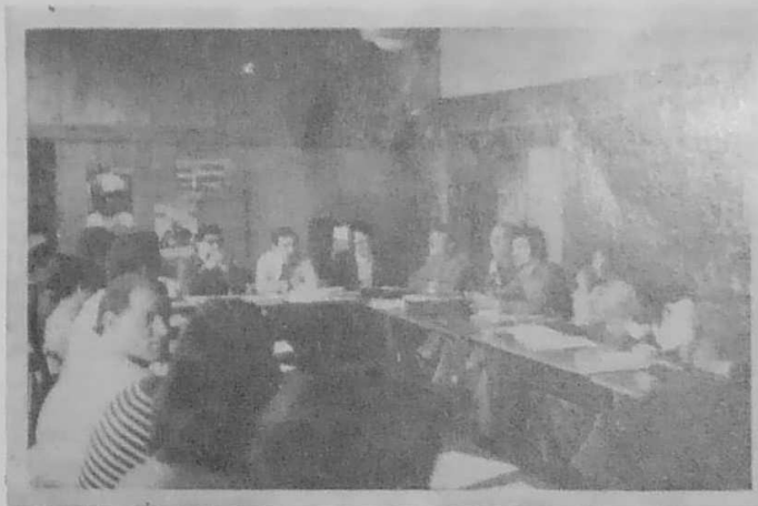
Ar C'huzul-seveniñ o labourat

N'EO KET KOULZ AR BINIOU HAG AR SONEREZH MEUR!