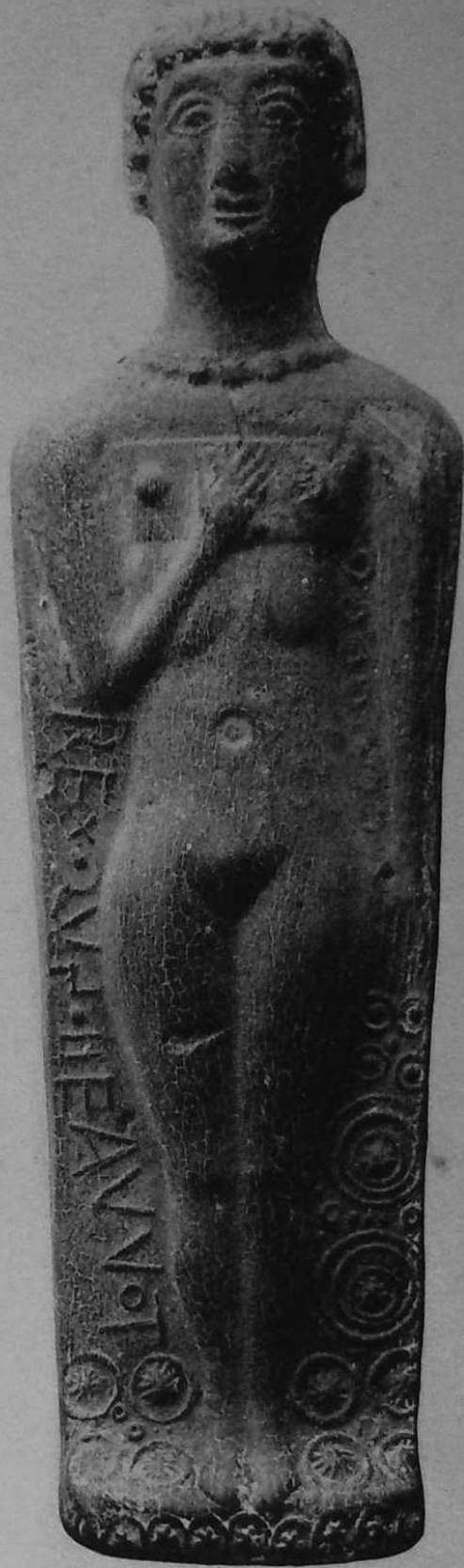
Statuette Gallo-Romaine du Camp de Kervénennec