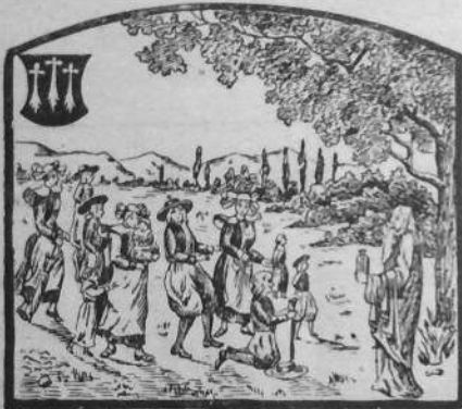
démie de Médecine, er ihuellan prim e ve reit.

Eit ésat é pedér er arnuegent d'er goal bas, bronchit, grip, influenza. El loéiad ketan e zistag grons er pas.