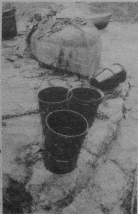
Guy Le Querrec-Magnum

Nann, planedenn Vreizh n'eo ket diremed : etre daouarn he bugale ema.