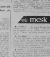
Le Bruch, est emblème magnétique