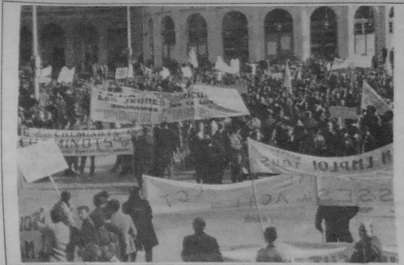
La manifestation stationne sur la place de la Mairie, à Rennes

Plus de 10 000 travailleurs, défilés par leurs compagnons de chantier, d'atelier, de bureau, venus du Finistère, du Morbihan, des Côtes-du-Nord, de l'Ille-et-Vilaine, se sont rassemblés le samedi 29 octobre dernier à Rennes.