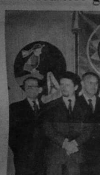
Assemblée de Labour Ha Kan

Après le succès de la dernière assemblée, nous sommes heureux de vous annoncer que nous serons de retour à Labour Ha Kan le dimanche 15 décembre. Cette fois-ci, nous avons préparé un programme très riche et varié, afin de satisfaire tous les goûts. Nous espérons que vous serez nombreux à nous rejoindre.