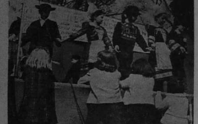
Plus de quatre mille personnes ont assisté à la fête de Gennevilliers le 2 mai...