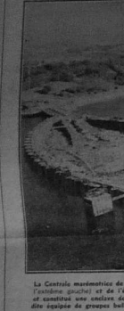
Le Centre nautique de la Rampe avec, à la pied sec, après la mise en service des vannes, (à l'arrière gauche) et de l'édifice (à l'arrière droit) des bâteaux qu'on va lancer à l'eau. L'édifice est construit sur un caillou de 40 hectares au large de la rampe, l'édifice nautique proprement dit est groupé autour de lui.

Est-il vraiment question d'immerger les déchets radio-actifs de Pierrelatte au large des côtes sud du Finistère, dans une zone de chalandage ? Les déchets radio-actifs de Pierrelatte sont-ils destinés à être immergés au large des côtes sud du Finistère ? C'est la question que se posent les habitants de la région. Les autorités locales ont annoncé qu'elles envisagent d'immerger ces déchets dans une zone de chalandage au large des côtes sud du Finistère. Cette zone est connue pour ses eaux profondes et sa faible population.