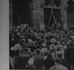
UNE PARTIE DE LA FOULE PENDANT LES ALLUCIATIONS PRONONCÉES LORS DES OUBQUES DE JULES TREMEL A SAINT-DENIS.